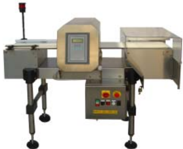
Metalim detector versione completa con nastro trasportatore e segnalazioni ottiche e uditive

Nonostante il Metalim sia dotato di alta sensibilità e forte potere discriminante è praticamente esente da falsi allarmi.