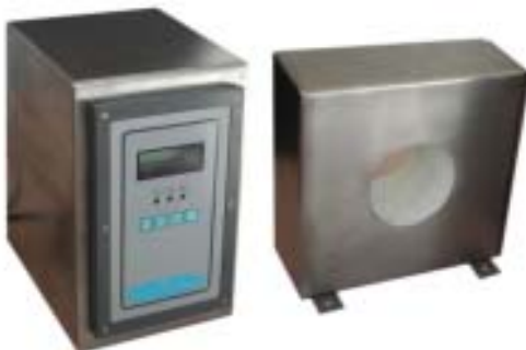
sistema Tunn-AI e centralina indipendente