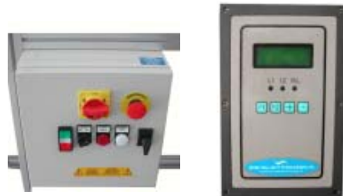
box controllo e centralina

Metalim, date le sue caratteristiche, lavorando a frequenze molto elevate, è in grado di rilevare i metalli sia ferrosi sia non ferrosi.