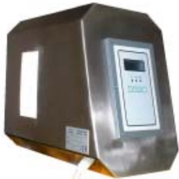
modulo base Comp-AI con centralina incorporata