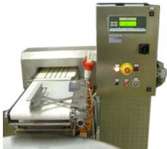
Metalim detector con selezionatore ponderale integrato per pesature statiche e dinamiche dei prodotti. Permette la rintracciabilità della fase di produzione.